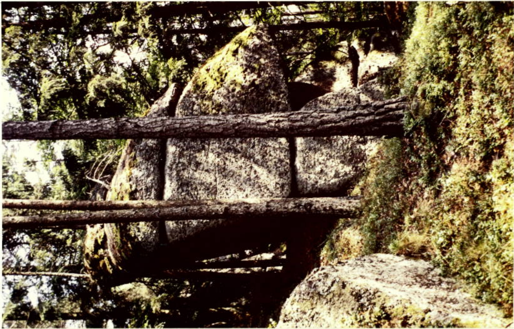
TEIL DER FELSGRUPPE ETWA 15-20m SÜDÖSTLICH DES GIPFELFELS

FOTOS: OBR. Dipl. Ing. PESCHER, GBA. IV STAND: JULI 1981