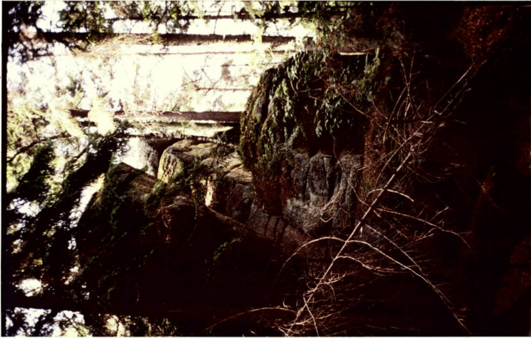
GIPFELFELSEN AUS OSTEN

STAND: JULI 1981