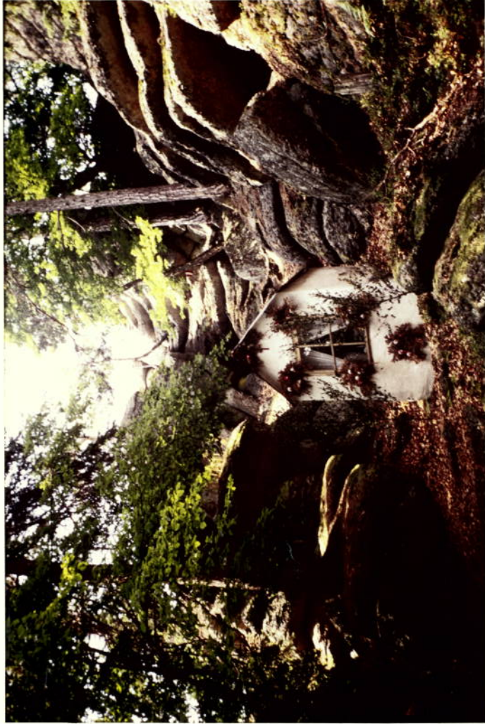
GIPFELFELSEN VON SÜDEN ( AUFSTIEGSRINNE MIT HARTEK)

FOTOS: OBR. Dipl. Ing. PESCHER, GDA. IV STAND: JULI 1981