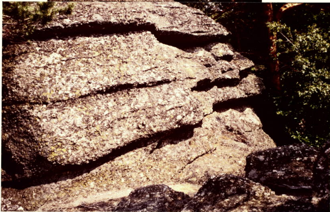
GIPFEL, AUS WEST, VOM NERBENGIPFEL AUS