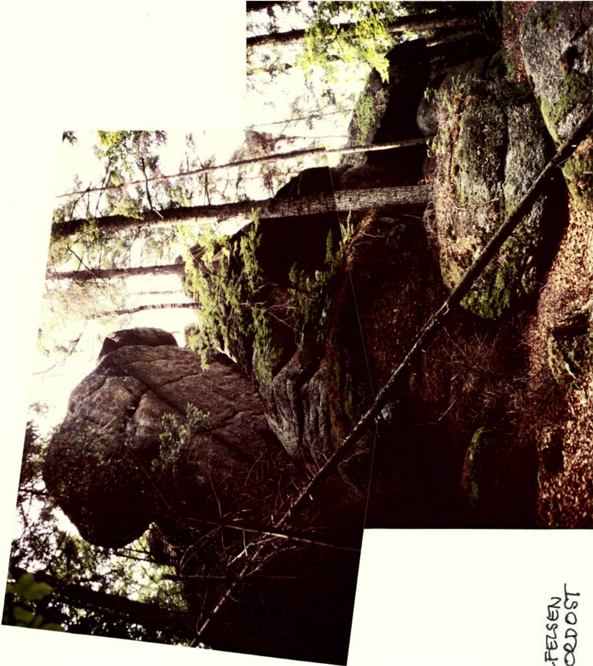
GIPFELSELSTEINE VON NORDOST