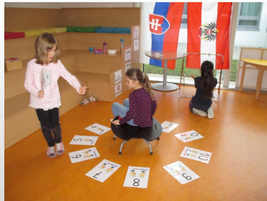
Zurndorfi Általános Iskola „Nyelvi sarok”